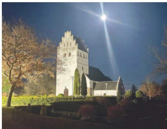
Det handler om at kaste lys på kirken...