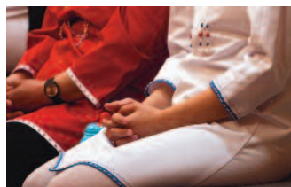
...at flette fingre med evigheden...

mit lille? Det er ikke sikkert, at ordene kommer med det samme, men de skal nok komme. Det at flette fingre med evigheden kalder på helende ord.