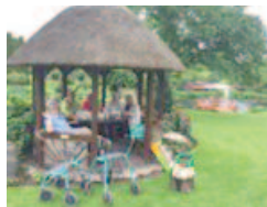
Billedet her er fra udflugten i 2019, hvor vi var i Kongsdal.