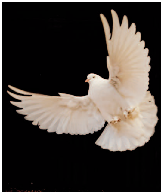
Når håbet får vinger...

Se, livets under! Opstandelse er for mig den virkelighed, som opstår, når hjertet formår at se og mærke livets under. Når ånden puster på hjertet, smelter det og bliver varmt bankende. Frygten forsvinder. Håbet får vinger. Når jeg lykkes med at se fra hjertet, ved jeg, at paradiset er en jordisk mulighed, for jeg er jo lige