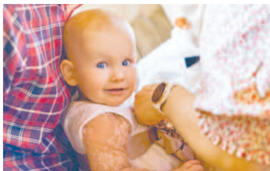
Hej. Jeg er lige blevet døbt ☺

En gang i kvartalet. Denne gang den 10. maj kl. 10.30 i Brenderup Kirke.