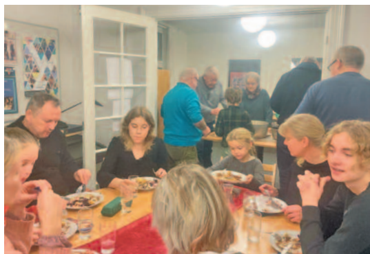
Samvær. Samtale. Samspisning. Åndelig føde til alle aldre.

Familiegudstjeneste og fællesspisning – 14. marts og 2. maj.