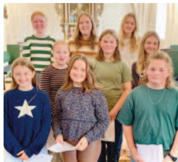
Vi er rigtig glade for ungdomskoret...

Ved at opslå organiststillingen, efter vi i en lang periode har haft mange vikarer, har vi nu bedre mulighed for at ændre på indholdet i stillingen, så der bliver plads til både ungdoms- og voksenkor og andre spændende tiltag. Vi er tæt på at kunne opslå den nye stilling og ser frem til en spændende ansættelsesproces.