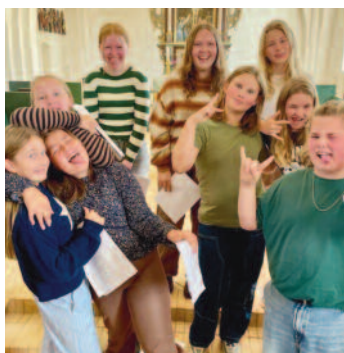
... som regel i al fald! ☺